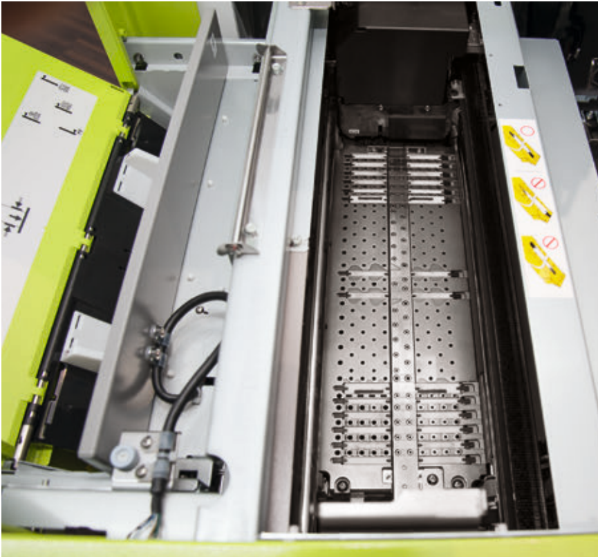
➤ Das geöffnete Deck gibt den Blick ins Geräteinnere frei. Von links nach rechts sind Teile des Einzelblatteinzugs, des Printerdecks und der Papierauslauf zu sehen. Abb.: fe