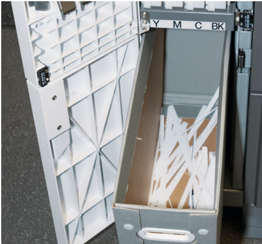
➤ Hinter einer Tür an der linken Frontseite des Gehäuses nimmt die leicht erreichbare „Schnipselbox“ den Papierbeschnitt auf.