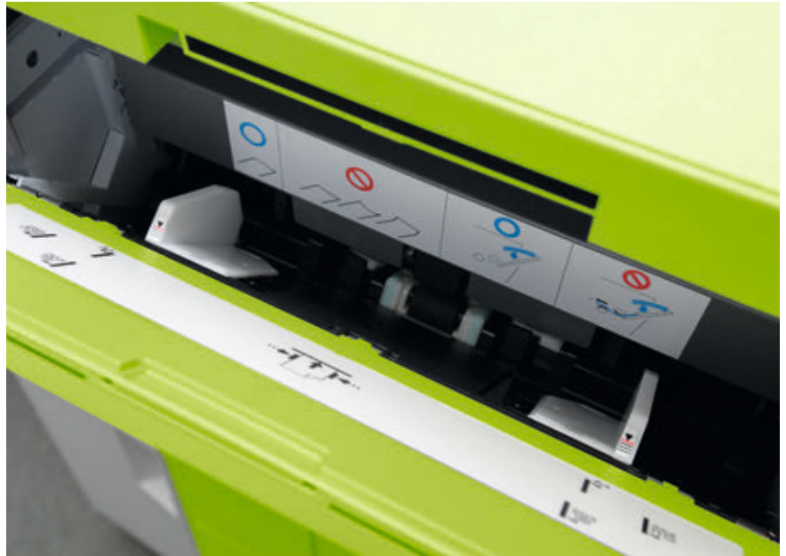
► Je nach Materialstärke nimmt der Einzelblatteinzug des QSS Green III 15 bis 32 Bogen auf. Abb.: fe

Bis zu 950 Bilder (Nennleistung) im Format 10 cm × 15 cm oder 1180 9 × 13-cm-Bilder kann das QSS Green III stündlich ausgeben, womit es die Verarbeitungskapazität einer 35er QSS-Nassmaschine übertrifft und die einer 3701 nur knapp unterschreitet. Die Leistung des QSS Green III reicht auch bei anderen Standardformaten aus, um im Volumensegment selbst größere Bildmengen zügig ausarbeiten zu können. So etwa 639 13 cm × 18 cm, 305 20 cm × 25 cm, 274 20 cm × 30 cm, 127 30 cm × 45 cm und immerhin noch etwa 55 30 cm × 91 cm große Panoramaprints. Für derlei Produktionen kommt ausschließlich 100-m-Rollenware zur einseitigen Bildwiedergabe zum Einsatz. Sie gibt es in den gängigen Fotopapierbreiten von 102 mm bis 305 mm. Der Vorschub ist – papierbreitenabhängig – von 89 mm bis zu 1400 mm in Millimeterschritten frei wählbar. Somit ist das Ausarbeitungsspektrum des QSS Green III mit dem Green IV weitgehend deckungsgleich, allerdings reicht die maximale Panoramabild-Schrittlänge des Green IV sogar