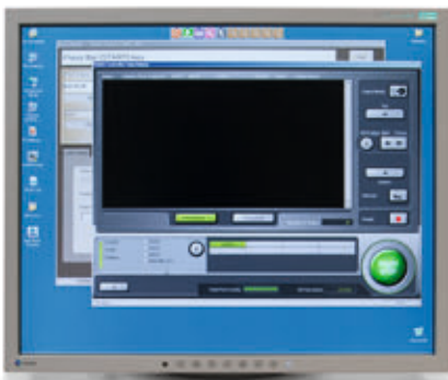
➤ Als „Steuerungsinstrument“ ist der „EZ Controller“ Bestandteil des Noritsu Green III.

Oben links am QSS-Green-III-Gehäuse befinden sich hinter einer Abdeckung Bedienungselemente, die für Wartungsarbeiten gut zu erreichen sind. Darunter sind – ebenfalls durch eine Gehäusetür verdeckt – die Aufnahmen für die Tintenkartuschen positioniert. Nach dem Schlüssel-Schloss-Prinzip „kodierte“, können die Tintenbehälter nicht vertauscht in die Schächte geschoben werden. Natürlich ist es möglich, während des Druckens unterbrechungsfrei leere Kartuschen gegen volle zu tauschen. Unterhalb der Tintenbatterie fängt hinter einer Abdeckung eine große Box die Papierreste des Beschnitts auf. Unten rechts unterm QSS-Green-III-Gehäuse verrichtet der