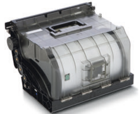
► Zur Magazin-/Papierererkennung ist ein RFID-Chip (das kleine grüne Viereck links) getreten. In der Mitte der abgebildeten Magazin-Längsseite befindet sich die Schleuse zum Be- und Entfeuchten des Papiers.

der mit bis zu 152 mm Breite haben auf den 12 Tableaus Platz. Zum Sorter gehört auch die von QSS-Geräten bekannte Unterbrechungsanzeige. Mittels roter und grüner LEDs markiert sie die Ablagefächer des Sorters, in denen sich die Bilder von zwischengeschobenen Aufträgen und die der unterbrochenen Aufträge befinden. Dadurch wird eine fehlerfreie Bildzuordnung zur jeweiligen Fotoarbeit ganz erheblich erleichtert. Bilder größerer Formate legt das Gerät auf eine Ablage, die sich oben links am Gehäuse befindet. Fotobuchcover und Panorama-prints landen auf einer nach vorn ausklappbaren Ablage in der Gerätemitte. Für den Transport zur linken Ablage beziehungsweise zum Sorter sorgt ein Transportband, das vor dem Trocknerauslauf positioniert ist. Anhand der Formaterkennung ordnet das QSS Green III die fertigen Bildprodukte automatisch der geeigneten Ablage zu.