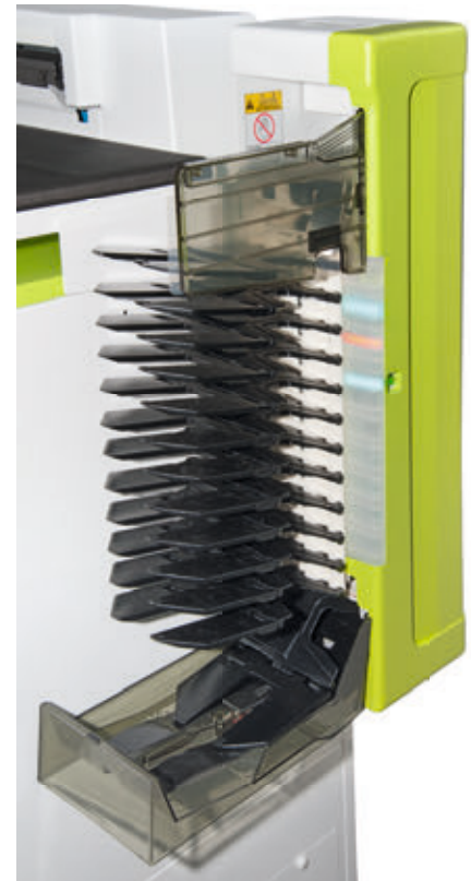
➤ Bestandteil des Sorters ist die Auftragsunterbrechungsanzeige. Farbige LEDs markieren zweifelsfrei die Sorter-Tableaus mit den Bildern der unterbrochenen Fotoarbeit und den Bildern des zwischengeschobenen Eilauftrags. Abb.: Noritsu

geräteeigene PC seine Arbeit. Die Schnittstellen sind über eine seitliche Abdeckung leicht erreichbar und so bequem mit Anschlusskabeln zu versehen. Selbstverständlich kann das QSS Green III die Bildaufträge der Konsumenten sowohl von Noritsu-Kunden terminals im Geschäft als auch vom Online-Bestellportal oder der App des Fotohändlers entgegennehmen. Optional bieten die Hünxer ihren Gerätekunden mit „Smart Picture Creation“ (SPC) eine eigene Online-Order-Software an.