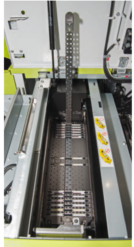
➤ Ein wesentlicher Bestandteil des Printerdecks sind die Absorber. Zum Reinigen lassen sie sich leicht entnehmen. Zuvor ist die – neue – Metallspange anzuheben, die die Absorber zusätzlich sichert.